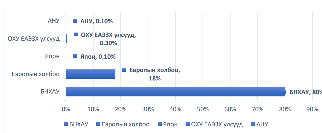
Хүснэгт 3. Угаасан, самнасан ноос ноолуур 2025 /түүхий эд импортлогч орнууд,хувиар/

Ноос ноолууран бүтээгдэхүүний экспортын нэг гол зах зээл нь Европын холбоо, нийт экспортын 20% орчим эзлэдэг. 2025 онд 29254 мянган ам.долларын ноос ноолууран бүтээгдэхүүн экспортлосноос 22626 мянган ам.долларын бүтээгдэхүүн Европын холбооны улсууд руу хийгджээ. БНХАУ руу 991 мянган ам.долларын бүтээгдэхүүн экспортлогдсон байна.